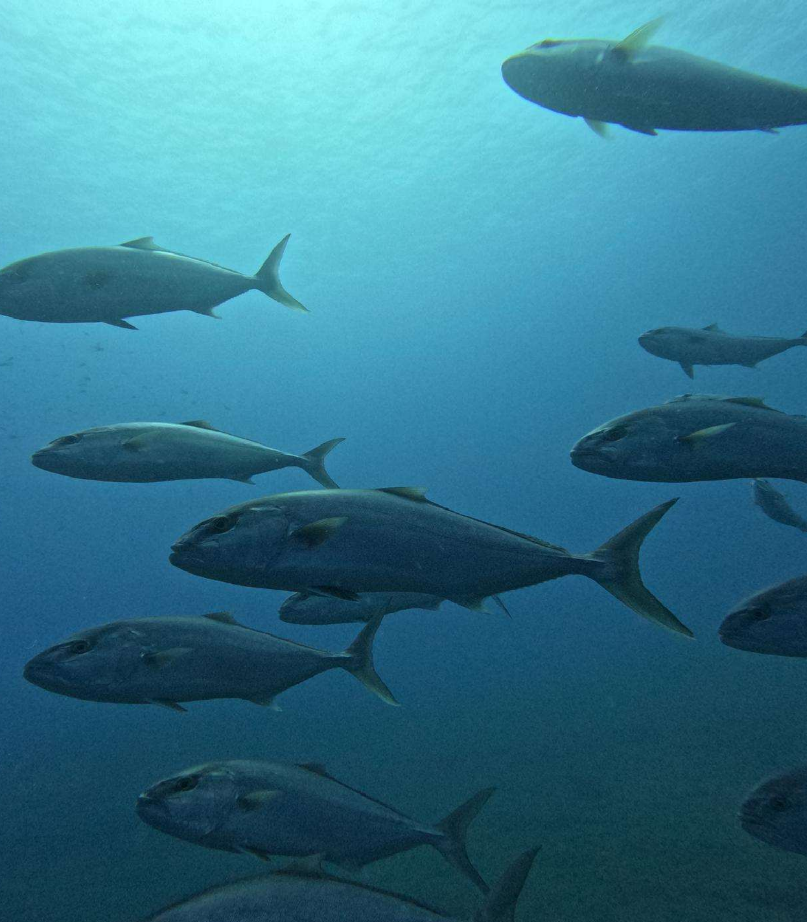
IN OCCASIONE DELL'IMMERSIONE DEL 31 AGOSTO 2024, PUNTA SCIU SCIA U' – AMP ISOLA GALLINARA